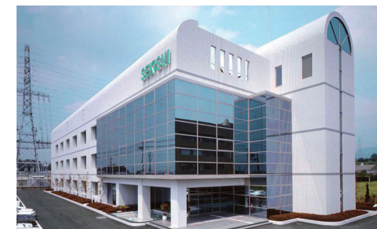
積水化成品工業株式会社

例えば、独自技術を駆使し生まれたピオセランは軽量性と緩衝性に優れた自動車部材として、また真球状微粒子ポリマーのテクポリマーはブルーライトを最大60%抑制し液晶ディスプレイに欠かせない部材として使われています。その他にも使用済み発泡スチロールの再利用、植物由来樹脂発泡体など環境良化に貢献する製品の開発にも積極的です。