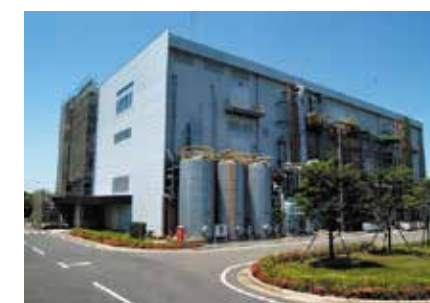
東洋合成工業株式会社 千葉工場

フォトレジスト用感光材とは、光や放射線によって固まったり溶けたりする感光性樹脂で、IC(集積回路)やLSI(大規模集積回路)などの半導体の製造工程で使用され、情報通信や電子関連産業では欠かすことのできない製品です。