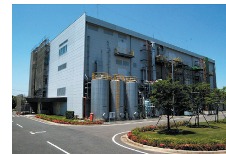
東洋合成工業株式会社 千葉工場

フォトレジスト用感光材とは、光や放射線によって固まったり溶けたりする感光性樹脂で、IC(集積回路)やLSI(大規模集積回路)などの半導体の製造工程で使用され、情報通信や電子関連産業では欠かすことのできない製品です。